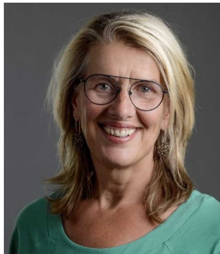
Jet Driessen van Onze Huisartsen